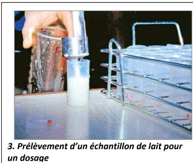
3. Prélèvement d'un échantillon de lait pour un dosage