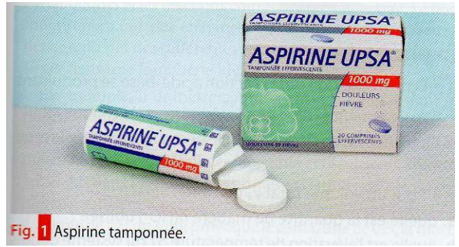
Fig. 1 Aspirine tamponnée.

Il est possible de réaliser au laboratoire une solution tampon. Des mesures de pH permettent d'analyser les propriétés d'une telle solution.