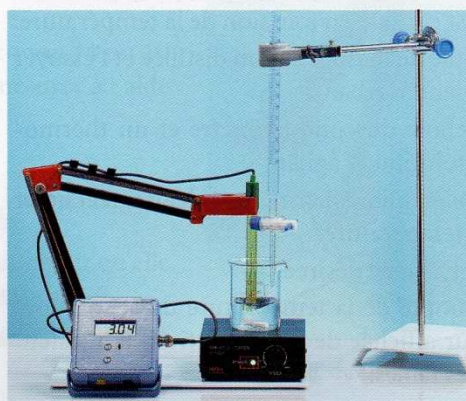
Montage de titrage pH-métrique.