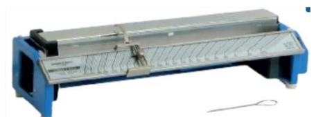
Doc. 3 Le banc Kofler est un appareil de mesure permettant de mesurer la température de fusion d'une substance solide.